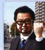
2019年 神奈川経営研究会 会長

平成最後の全国大会を通して、ご参加して頂いた皆様に元気になって頂きたいです。業績向上のヒント、新たなビジネスモデルのヒントが皆様の一つでも多く伝わる全国大会に必ずしていきます。神奈川経営研究会と副主管の熱意をあなたの目で是非ご確認ください。