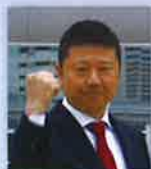
日創研経営研究会 全国大会 in 神奈川2019 実行委員長

〒220-8173 横浜市西区みなとみらい 2-2-1-3 URL: https://www.yrph.com/